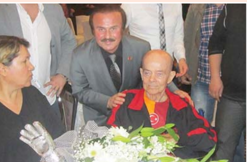
Gecede Turgay Şeren ağabeyimle kısa bir sohbet de yaptık...

Turgay Şeren'e Vefa gecesinde birçok seçkin konuk vardı. Büyük bir moral kazanan efsane futbolcu, "Bamam Sabit Şevki Şeren, Atatürk'ün Özel Kalem Müdür Muavini idi. Bu nedenle Ata'mızla sık sık karşılaşıyordum... Ben henüz 4-5 yaşlarındaydım o yıllarda. Atatürk bir gün beni başımdan okşamı ve adımlı sordu. Ben de, "Sabit Şeren" diye cevap verdim. Atamız, babamın da bulunduğu ortamda, "Senin adın bundan sonra TÜRKAY olsun" dedi. Uzun süre bu isimle anıldım. Ancak ülkemizdeki yabancı antrenörler TÜRKAY demekte zorlandıkları için bana TURGAY demeye başladılar. İsmim de böyle kaldı. Buraya geldiniz ve bana unutulmaz bir gece yaşattınız. Seneye sağsak bu kez daha güçlü bir Turgay Şeren olarak hepimizi omuzlarımızda taşıyacağım" diye duygulu bir konuşma yaptı.