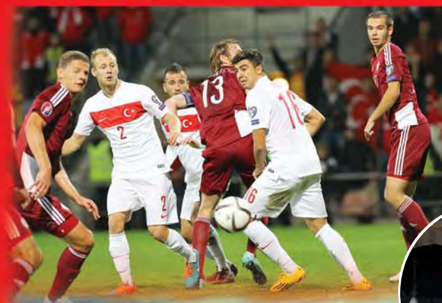
KONYA BÜYÜKŞEHİR TORKU STADI

Fatih Terim patronajındaki A Milli Futbol Takımımız, Konya Büyükşehir Torku Stadi'nda ikinci mücadelesini 6 Eylül 2015'de akşam Hollanda karşısında verecek. Amsterdam'daki ilk maçta Burak'ın harika golüyle öne geçen Türkiye galibiyete çok yakinken, Sneijder'in son dakikalardaki golüne engel olamamış ve maç 1-1 berabere bitmişti. A Milli Takımımız, 6 Eylül 2015 günü Hollanda ile Konya'da oynayacağı 2016 Avrupa Şampiyonası eleme maçı ile birlikte bu ülke ile tarihindeki 12. maçına çıkacak. Hollanda ile şimdiye kadar 7'si resmi 4'ü özel olmak üzere toplam 11 kez karşı karşıya gelen Ay-yıldızlı ekibimiz, bu maçlarda 2 galibiyet, 4 beraberlik alırken, 5 kez de sahadan yenik ayrıldı. Millilerimiz, attığı 6 gole karşılık, kalesinde 13 gol gördü.